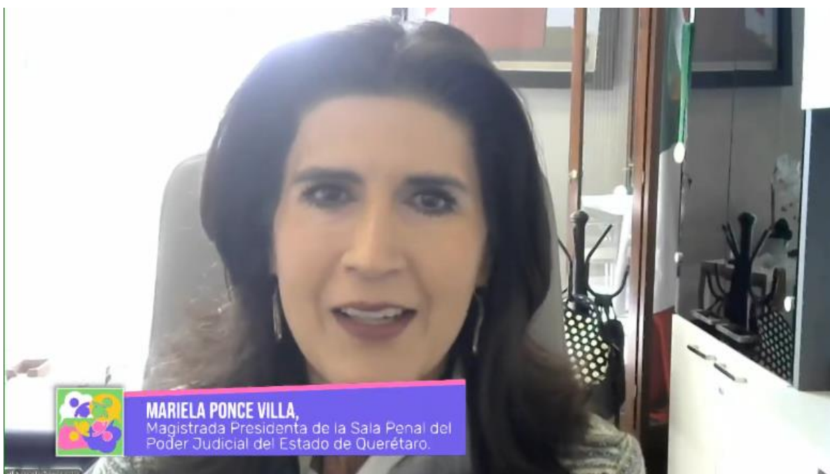
Foto: Mariela Ponce Villa, Magistrada Presidenta de la Sala Penal del Poder Judicial del Estado de Querétaro durante su intervención inicial.