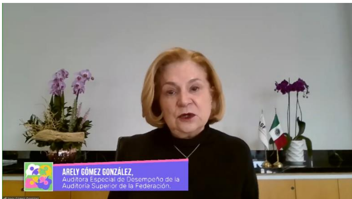
Foto: Arely Gómez González, Auditora Especial de Desempeño de la Auditoría Superior de la Federación durante su intervención inicial.