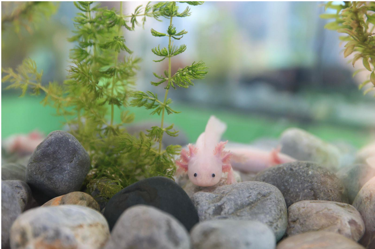
Foto: Ejemplar de la especie Ambystoma Mexicanum (ajolote), nombrada como Yectli ; habitante permanente del Museo Nacional del Axolote.