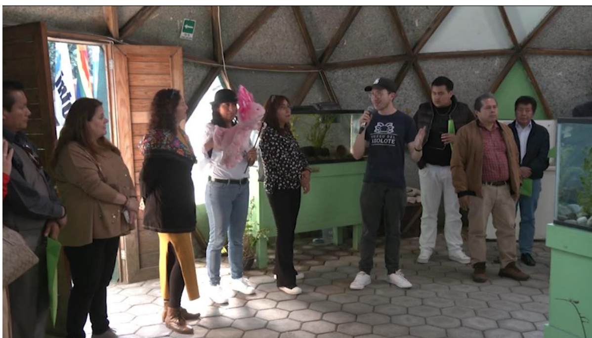
Foto: Visita guiada por el Museo Nacional del Axolote ofrecida a los asistentes de la Ceremonia de Nombramiento "Yectli, la ajolotita de la transparencia".