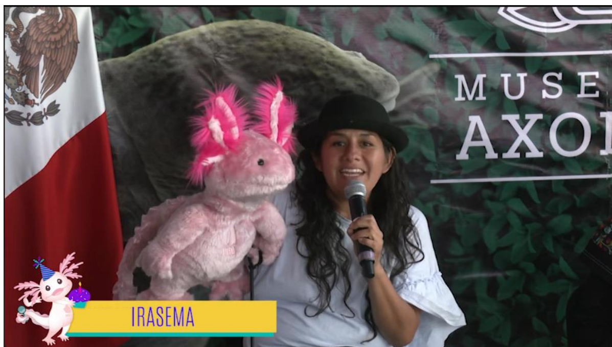
Foto: Irazema Hernández, durante su intervención e interpretación de Yectli durante la Ceremonia de Nombramiento “Yectli, la ajolotita de la transparencia”.